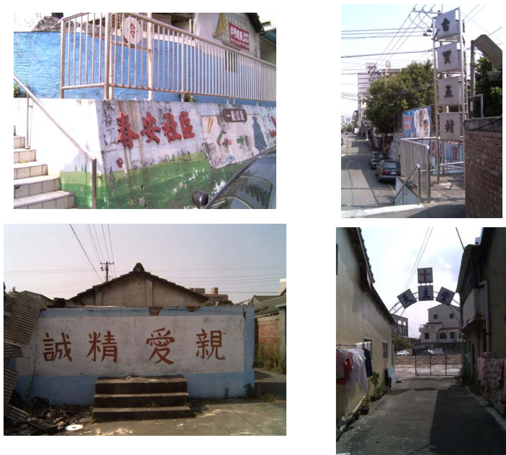
圖 2 社區標記的保存