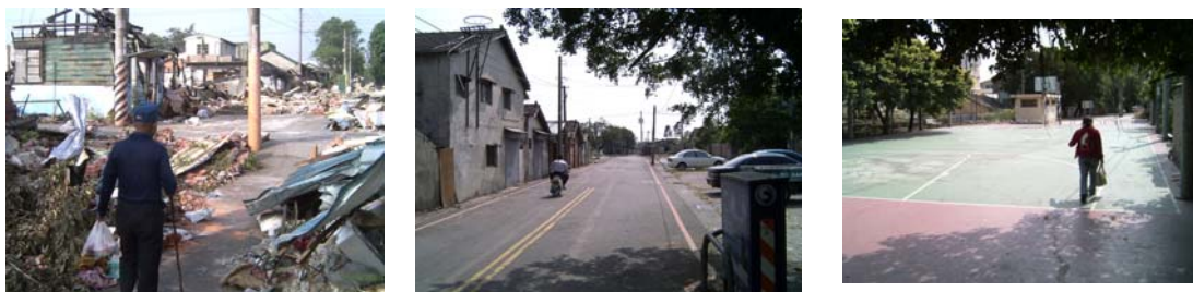
圖 1 社區內尚未搬遷的居民行進在社區中

目前仍舊居住在此處的少數幾戶居民，由於長期定居在這裡，對此地保有一份特殊的情懷，因此仍留在這個逐漸落寞的社區居住、運動、穿越等。對他們而言，原有的社區空間已經被破壞了，社區原有的面貌和機能也完全改觀了，但是他們仍舊願意留到最後一刻。