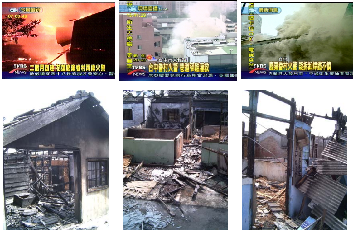
圖 6 火災新聞報導和災後面貌