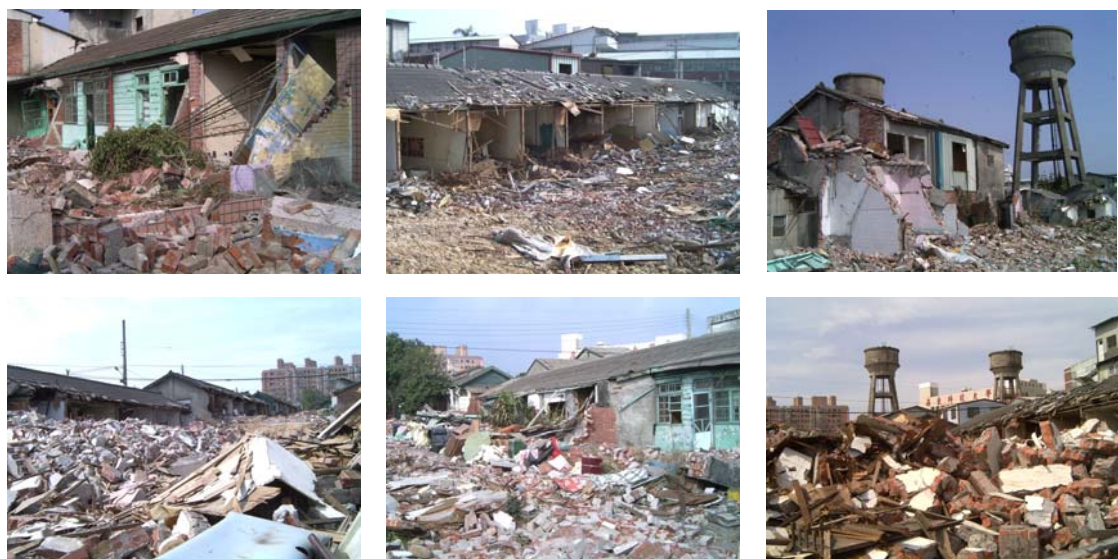
圖 3 社區內各式房舍建築拆除狀況

此處的老舊無法短期之內一次全部拆除完畢，因此是逐漸地拆除舊有房舍。因此推土機和拆除機具進進出出此一社區。拆除後的廢棄磚瓦仍舊大量地棄置在原地。