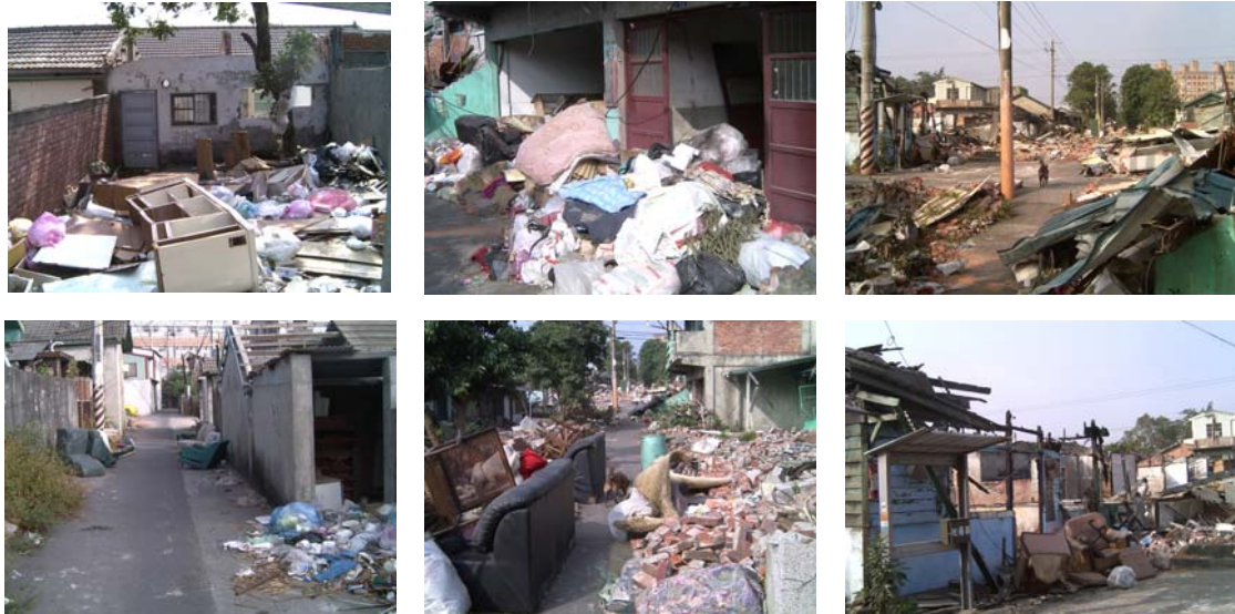
圖 4 社區內隨意棄置的垃圾現象

廢棄物不斷地出現並棄置在路旁，形成堆聚成群的垃圾，清運之後又不斷地出現。原因之一是原本住家搬走之後所留下的廢棄家具並沒有全部清運走，陸陸續續又清出來的廢棄家具堆置在空地。其二是眷村周邊社區的居民和行經此路段的人隨意丟棄垃圾。