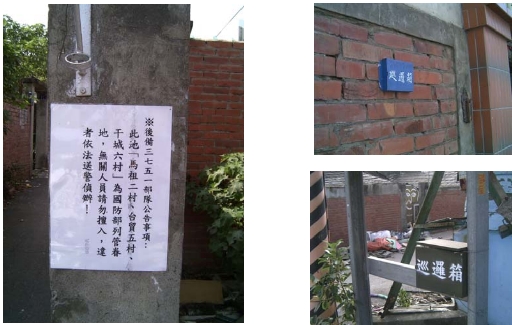
圖 7 巡邏箱的設置和軍方警告標示

的確，拆遷進度推持落後導致衰敗地景漫長地折磨周邊社區和大學，這個眷村目前仍舊處在動態的變化當中，附近的居民現在最希望的是，國防部能如期拆村，以防意外再度發生。由於廢棄物的清理和房舍的拆除無法在很短的時間之內完成，因此每間隔一段時間，這裡的景觀就會有所變異，這個變異的地景，不斷地揭示出此地的蒼涼，最後一次地向世人展示出此地原有的風華，在短暫五十年的風華過後，就如同萬物生命一樣，成住壞空，走向灰燼。這個社區仍舊處在動態的變化當中，由於廢棄物的清理和房舍的拆除無法在很短的時間之內完成，因此每間隔一段時間，這裡的景觀就會有所變異，這個變異的地景，不斷地揭示出此地的蒼涼，最後一次地向世人展示出此地原有的風華，在短暫五十年的風華過後，就如同萬物生命一樣，成住壞空，走向灰燼。